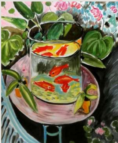
The Goldfish , par Henri Matisse, 1912

A travers ce bocal de poissons rouges on retrouve un assemblage de couleur vive . Les poissons dégagent une impression chaleureuse qui contraste avec le vert accueillant des plantes à l'arrière plan . Cette peinture aux couleurs et à l'atmosphère estivale semble familière de par son sujet ce qui renforce son caractère chaleureux .